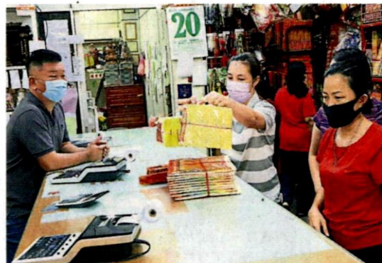
神料店获准营业, 业者消费人均松了一口气。

农历新年、清明节及盂兰节, 占全年营业额超过一半以上。去年, 业者们已错过清明节和盂兰节, 今年又险些和新春市场失之交臂, 一度忧心不已。