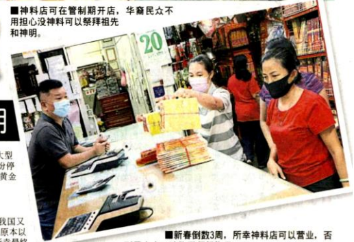
■新春倒数3周，所幸神料店可以营业，否则民众也无法张罗拜祭物品。

业，恐怕许多业者都会面临倒闭危机，市议会的宣布终于可以安心。他们也感谢当局体谅，允许他们