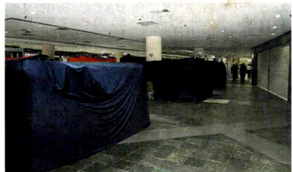
■士拉央市议会执法队伍在购物广场进行巡查,确保商家遵守标准作业程序。