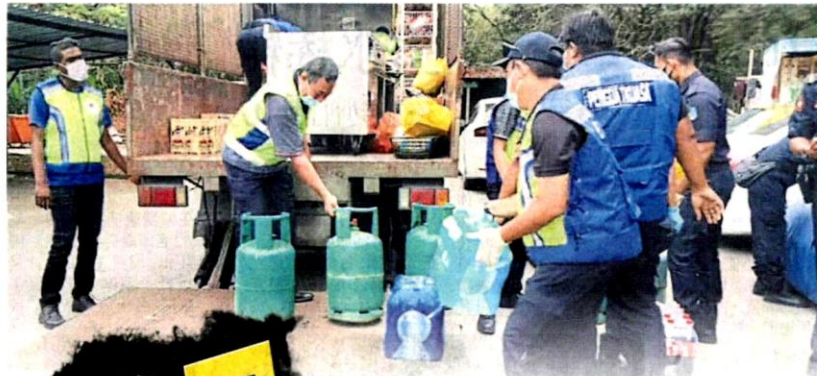
■市议会出动大批执法人员，继续对付违规开店的劳板。