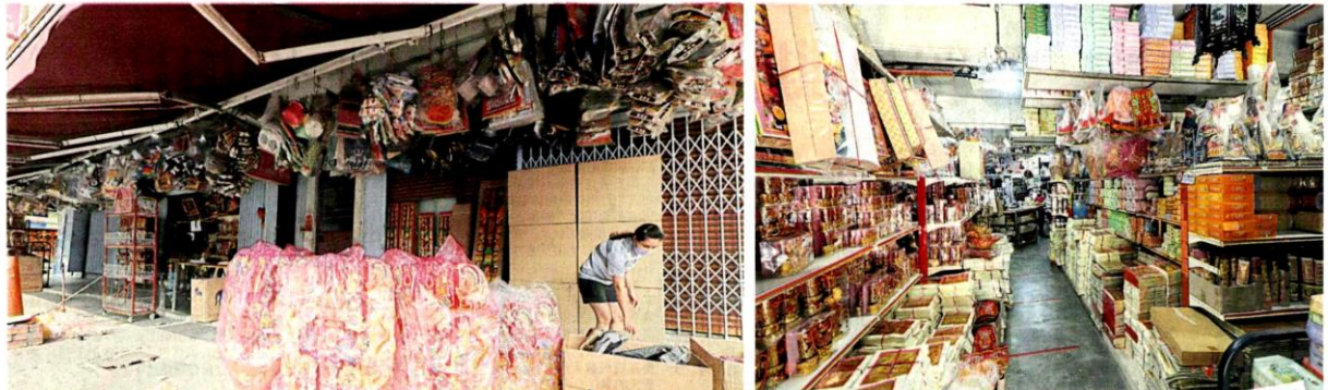
■业者受促留意，不可大肆霸占走廊，避免违反市议会条例。