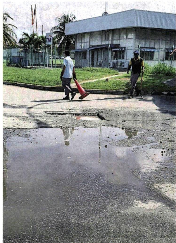
■ 巴生地区路坑处处，严重威胁驾车人士的安全。

根据雪州警方，雪州路洞问题严重，2018年至2020年的3年期间，雪州便有222宗涉及路洞问题的交通意外，夺走148条人命。