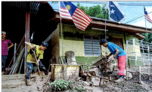
ULAMA kontemporari seperti Dr. Yusuf al-Qaradawi mengharamkan wang zakat digilkan kepada mangsa mangsa banjir di bawah asnaf gharimin (orang yang berhutang).