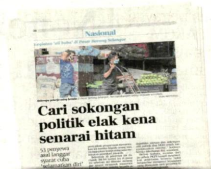
Keratan akhbar BH semalam.

"Ada juga kesalahan yang dikesan apabila penyewa lot asal yang menyewa atas nama syarikat berdaftar di mana hampir semua pengarah syarikat perniagaan itu adalah warga asing, malah ada lot jualan milik wanita warga tempatan sebagai penyewa asal, namun diuruskan oleh suaminya seorang warga asing," katanya.