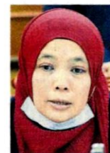
守标准作业程序。 艾丽雅提醒神料店业者

业者也说, 新年是最大黄金期, 营业额占全年超过 25%, 若这次再不获准业, 恐怕很多人将受影响, 尤其一些