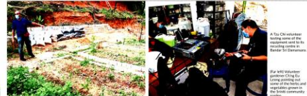
A Top Chewahinter (middle) and a group of volunteers working on a community project in Bandar Sri Damansara.