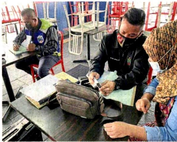
■市议会官员发罚单给违例食肆业者。