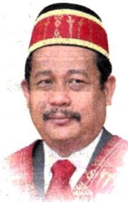
■ 主要是因为重型交通工具所致，阿末法兹里：这些道路损坏，

他说，这些维修工作，都是涉及隶属市议会的道路，即大部分是在商业区和住宅区及非大道公路。