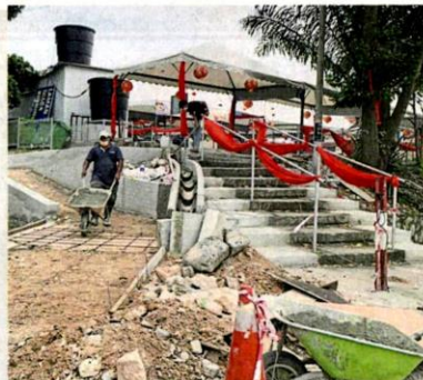
■双溪龙新早市巴刹出入口已提升。