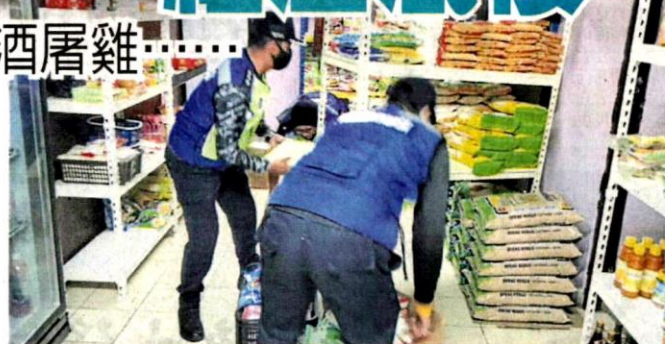
■外劳所经营的杂货店麻雀虽小，但是货物也算应有尽有。

他说，市议会经常接获投诉，组屋的住宅单位不只是被改为商业单位，甚至住宅前的空地也被霸占，作为营业地点，市议会日後不会再给予通融，将直接对付。