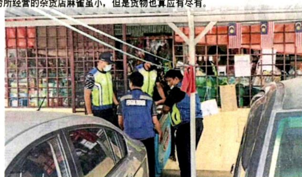
■外劳还非法售卖烈酒，全被充公带走。

李富豪指出，该组屋区是新冠肺炎疫情最严峻地区之一，当地出现多个感染群，其中最大感染群确诊病例相信已经超过千宗，虽然近期当地的病例已经疏緩，但大家不能