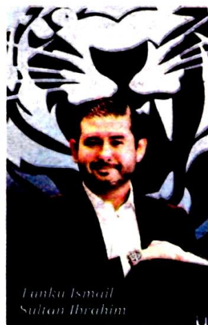
Tunku Ismail Sultan Ibrahim

JDT are also the first team in Southeast Asia to win the AFC Cup after beating Tajikistan's Istiklol 1-0 in the final in Dushanbe in 2015.