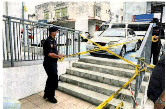
■执法人员封锁一些路口,避免公众可随处进出。

公众可致电03-61265800做出询问或投诉,或浏览www.mps.gov.my及官方面子书等。