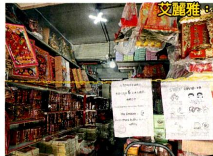
■业者做足防疫措施，同一时间仅允许5人入店，避免拥挤。